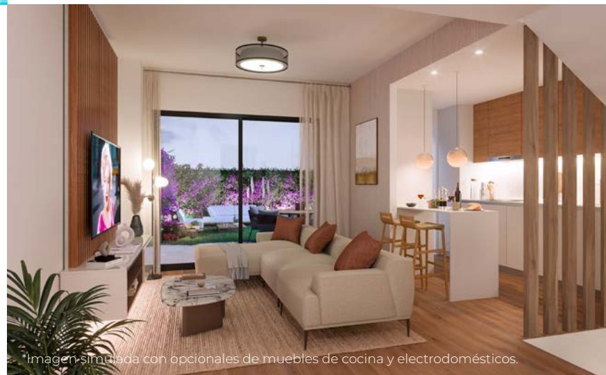
Imagen simulada con opcionales de muebles de cocina y electrodomésticos.