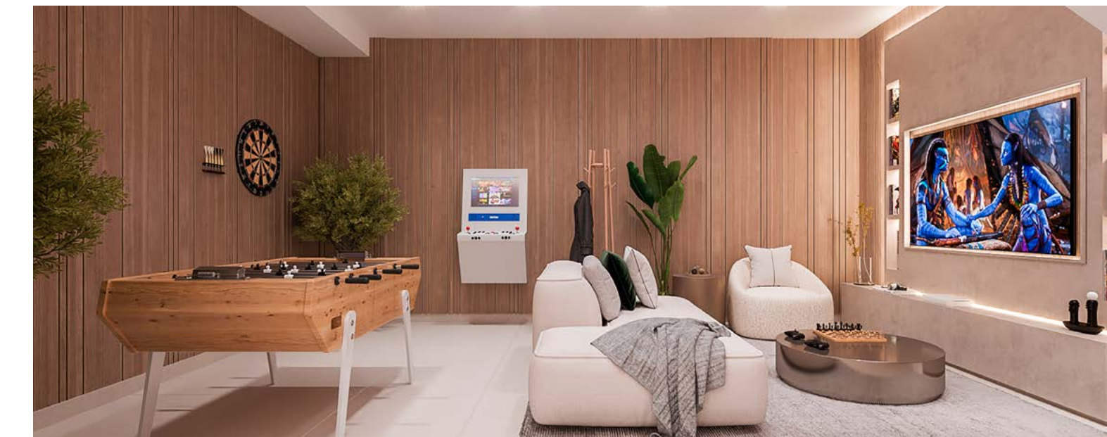
*Simulación de zona de ocio con acabados opcionales.

Muy cerca de Los Nogales Living, a escasos minutos, podrás contar con una variedad de servicios como son restaurantes, supermercados, centros médicos, centros culturales., etc. Además podrás acceder cómodamente a la autopista A7 a los destinos preferidos.